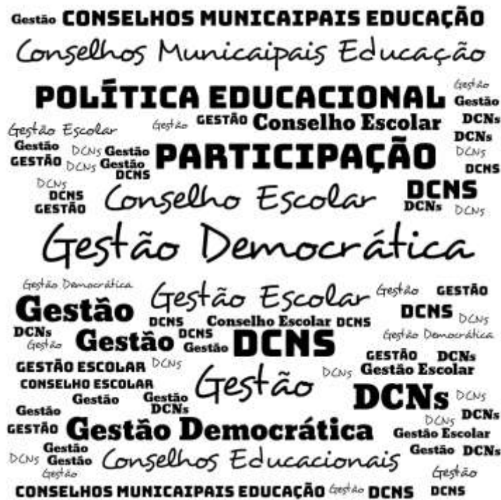
Figura 1 – Nuvem de Palavras: Palavras-chaves