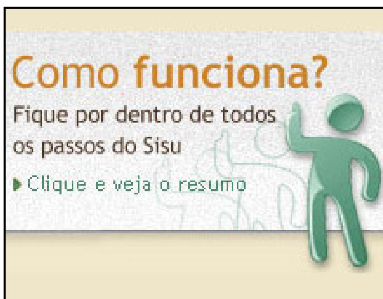
Figura 1. Figura link que redireciona para a página oficial do SISU no MEC, sob o endereço eletrônico http://sisu.mec.gov.br/#/principal.php .

Na Figura 1 é apresentada a figura ilustrativa para dar acesso ao link que redireciona para a página oficial do SISU no MEC, sob o endereço eletrônico http://sisu.mec.gov.br/#/principal.php . Ao fazer parte do portal, na primeira página, o link mostra ao internauta estudante do ensino médio, sempre que ele entrar na página, de modo a se preparar previamente e a se programar para o exame. Ao acessar o SISU de dentro da página, onde os cursos oferecidos também são mostrados (Figura 2), a Unidade induz o candidato a considerar um dos cursos oferecidos pela unidade como uma escolha possível.