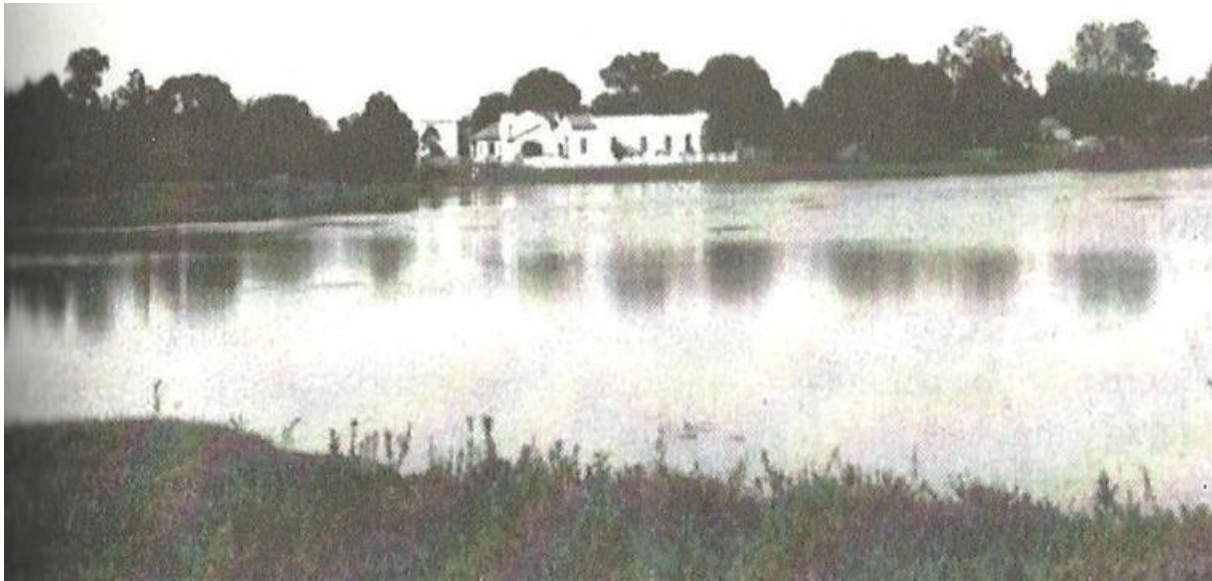
Figura 1. Vista Parcial de la Laguna Punta Porã a mediados 1.940.

De acuerdo con Roig (1984), la Laguna Punta Porã, es el símbolo más representativo de la ciudad de Pedro Juan Caballero. En sus proximidades tuvo origen la ciudad, precisamente porque había una laguna que servía de fuente de agua. En la Figura 1 se presenta una vista parcial de la Laguna Punta Porã a mediados de la década de 40.