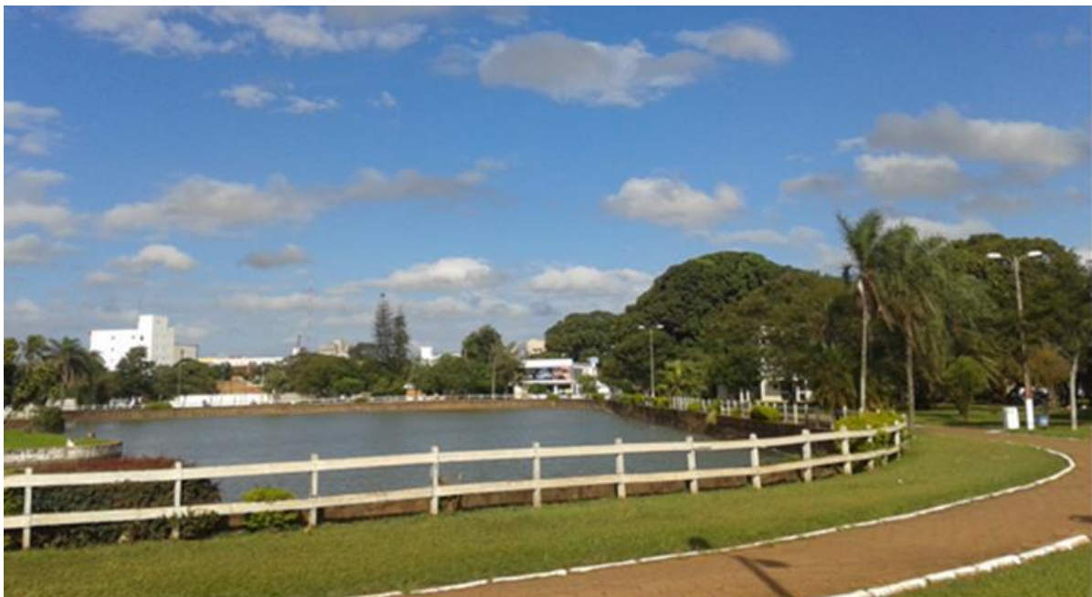
Figura 2 Vista Parcial de la Laguna Punta Porã.

En la parte de arborización se plantó Lapacho, Quebracho, Pacurí, Chivato, Sauce y otros árboles de ornamentación. En algunos casos se realizó el trasplante de arboles ya desarrollados (aproximadamente de 5 a 8 metros de altura). En la Figura 2 se tiene una vista parcial de la actual Laguna Punta Porã.